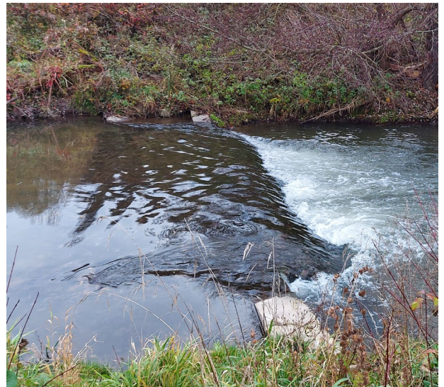
Sohlstufe südlich Freienorla